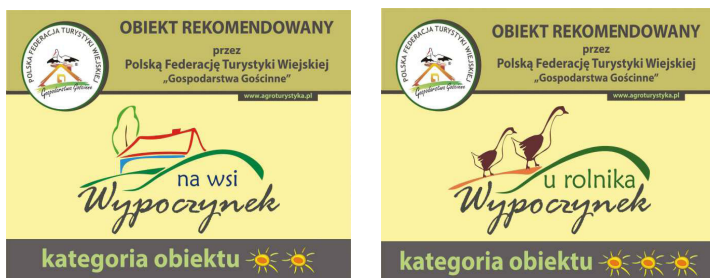
Rysunek 1. Loga obiektów kategoryzowanych w Polsce Figure 1. Logos of objects categorized in Poland Źródło: www.pftw.pl , dostęp z dnia 6.11.2017 Source: www.pftw.pl access of the day 6.11.2017

Problematyka standardu jakości w turystyce wiejskiej i agroturystyce kojarzona jest z Polską Federacją Turystyki Wiejskiej „Gospodarstwa Gościnne” (PFTW „GG”). Kategoryzacja Wiejskiej Bazy Noclegowej to dobrowolna ocena obiektów turystyki wiejskiej według systemu zarządzanego przez PFTW „GG”. Celem kategoryzacji jest podnoszenie jakości świadczonych usług w obiektach turystyki wiejskiej oraz rekomendacja i promocja obiektów poddanych ocenie kategoryzacyjnej. Kategoryzacji mogą być poddane obiekty, w których świadczone są usługi noclegowe wraz z usługami towarzyszącymi w zakresie turystyki wiejskiej, będące własnością osób zrzeszonych oraz niezrzeszonych w stowarzyszeniach PFTW „GG”. Ocena Wiejskiej Bazy Noclegowej dokonywana jest na podstawie kryteriów zawartych w wymaganiach kategoryzacyjnych. Na podstawie oceny według systemu kategoryzacji Wiejskiej Bazy Noclegowej przyznaje się ocenę poszczególnych pokoi, łazienek, samodzielnych jednostek mieszkalnych oraz usług towarzyszących, w skali od jednego do trzech słoneczek. Ogólna ocena obiektu od-