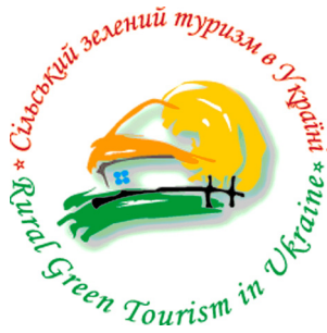
Rysunek 2. Logo „Zielone Gospodarstwo”